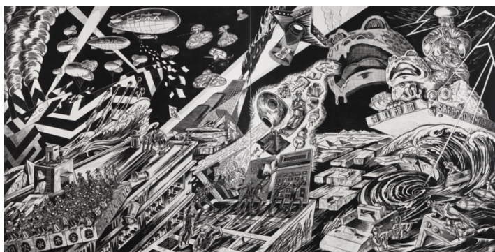
《第一次幻惑大戦》2017年 横浜美術館蔵 木版（油性インク／和紙、パネル） 182.5×362.0cm