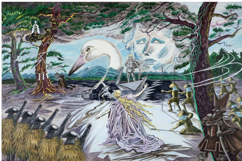
《ありがとう、我が愛する白鳥よ！》2026年 作家蔵 ©Sachiko Kazama Courtesy of the artist and MUJIN-TO Production Photo by Kei Miyajima 油彩 97.0×145.5cm