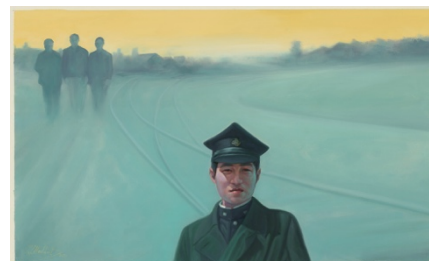
小沢剛《帰って来たS.T.》(部分) 2020年 弘前れんが倉庫美術館蔵