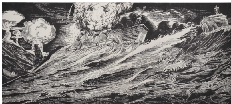
《噫！怒涛の閉塞艦》2012年 東京都現代美術館蔵 木版（墨／和紙、パネル） 181.0×418.0cm

吹き抜ける空間が特徴的な当館の展示室を中心に、近年の風間の活動を象徴する大型の木版画を展示します。2011年の東日本大震災と福島第一原子力発電所事故を契機に制作された《噫！怒涛の閉塞艦》（2012年）では、核と原子力をめぐる歴史上の災害と人間社会の関係を描き出し、《ディスリンピック2680》（2018年）では、2020年に予定されていた東京オリンピックと、1940年に開催が予定されつつも戦争のために開催が見送られた幻の東京オリンピックを重ね合わせて描きました。《第一次幻惑大戦》（2017年）では、江戸時代の小説に登場する架空のヒーローである妖術使いの児雷也が、現代での社会規範の中で生きるサラリーマンとの戦いを繰り広げる様子を描いています。近現代社会の仕組みと個人のはざまの葛藤を、寓話的なイメージによって構成した作品を紹介いたします。