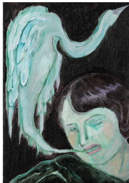
《白鳥の聲が聞こえる》2026年 作家蔵 ©Sachiko Kazama Courtesy of the artist and MUJIN-TO Production Photo by Kei Miyajima 油彩 22.7×15.8cm

本展は、近現代の社会や制度、歴史を起点に、壮大な空想の物語を編み出す、風間の活動の軌跡と現在地を示す機会となります。