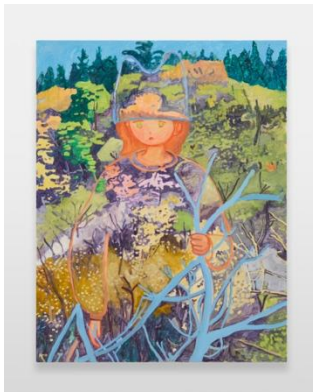
工藤麻紀子《春の山をあみこむ》2023年