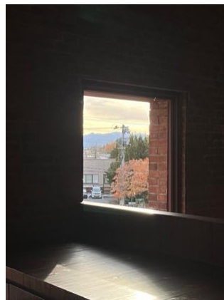
[参考図版] 佐藤朋子 新作のためのイメージ