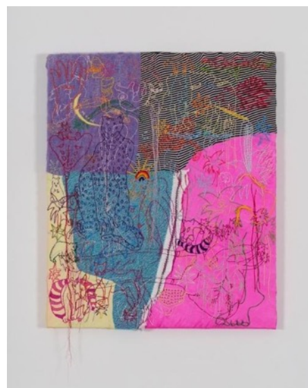
川内理香子《PIC-NIC》2024年 ©Rikako Kawauchi, courtesy of the artist and WAITINGROOM

ここに登場するのは、食べ物とそれを取り込む身体や、人間と動物が重なりあうような神話的なイメージを描き出す川内理香子の絵画や刺繍、外来種を含む動植物が生息する水槽をつないで循環させることで、生き物が影響し合うあらたなシステムを作り出す渡辺志桜里のインスタレーション、さまざまな場所の地下空間を滑走するスケーターたちを捉え、普段は目に見えない巨大な地下都市の存在を浮かび上がらせるSIDE COREの映像作品などです。本展を通じて、自分たちそれぞれにとって、遠い理想郷ではない未来のユートピアとは何か、考えるきっかけになることを目指します。