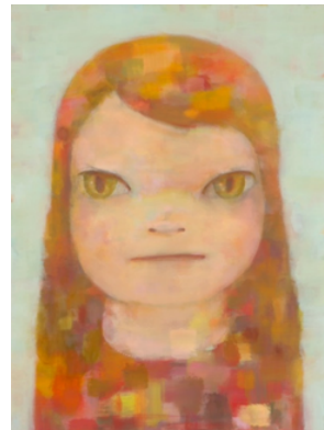
奈良美智《Girl from the North Country (study)》2025年 © Yoshitomo Nara Courtesy of Yoshitomo Nara Foundation