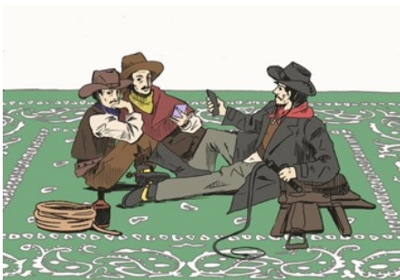
[作品イメージ] ユーイチロー・E・タムラ《草上の休息》2024年