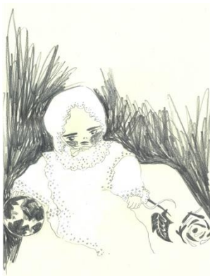
小林エリカ《誕生》(《旅の終わりは恋するものの巡り逢い》より) 2021年 弘前れんが倉庫美術館蔵 © Erika Kobayashi Courtesy of artist and Yutaka Kikutake Gallery