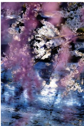
蜷川実花《花、瞬く光》2022年 ©mika ninagawa, Courtesy of Tomio Koyama Gallery