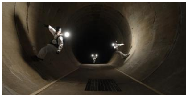
SIDE CORE《under city》ongoing