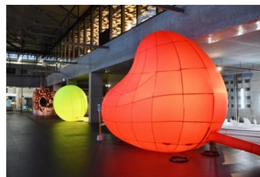
[参考図版] さとうりさ《本日も、からっぽのわたし #3 (月と心臓)》2024年 越後妻有里山現代美術館 MonET 展示風景