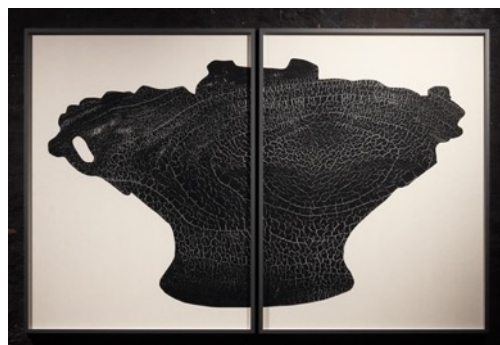
大巻伸嗣《Abyss - Jomon》2023年