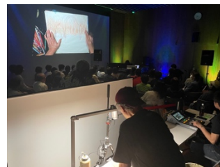
H-MOCAライブ「細海魚×ヤマジカズヒデLIVE “A night OWL like a FISH”」奈良美智によるライブドローイングの様子 (2025年6月15日)

弘前市出身の奈良美智による新作の絵画《Girl from the North Country (Study)》(2025年)のほか、昨年当館のスタジオで開催したH-MOCAライブ「細海魚×ヤマジカズヒデLIVE “A night OWL like a FISH”」に奈良がゲスト出演した際に制作されたドローイングなど、作家と故郷のつながりを示す作品を、奈良が弘前で高校時代に仲間と共に作り上げたロック喫茶「JAIL HOUSE 33 1/3」の再現とともに展示します。