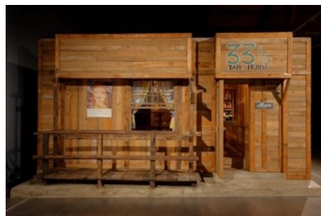
ロック喫茶「JAIL HOUSE 33 1/3」再現展示 一般財団法人奈良美智財団蔵 弘前れんが倉庫美術館での展示風景