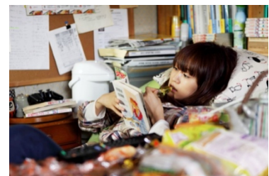
『もらとりあむタマ子』