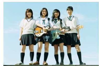
『リンダリンダリンダ』